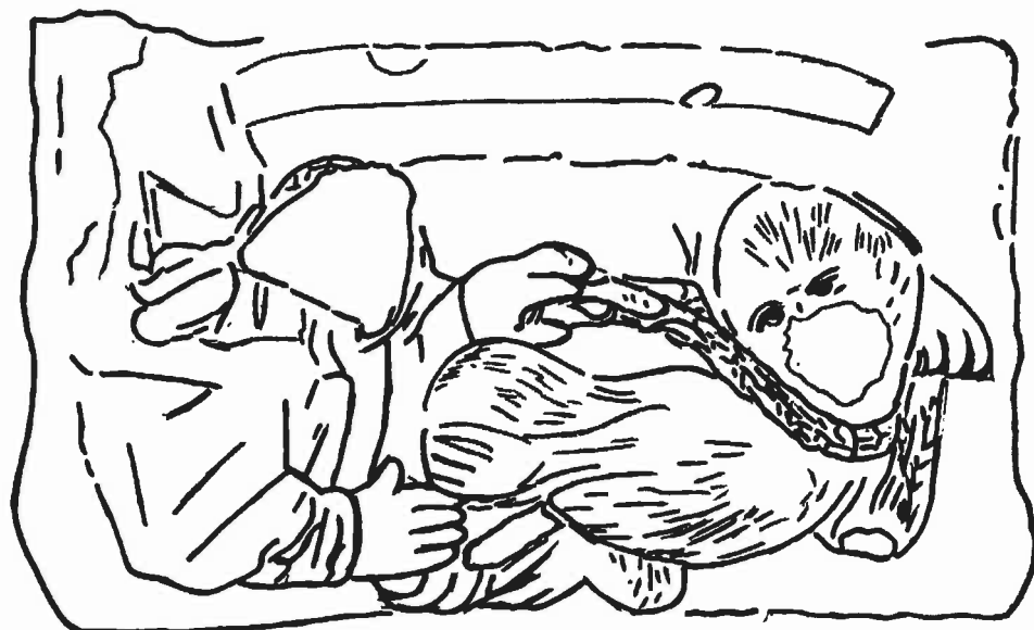
Planche 2. Cloître de Carennac (Lot). Le saint, vêtu en moine, comme à Cadouin, et peut-être nimbé, tient au bout de son étole, devenue une corde (ou une chaîne), un démon velu aux pattes griffues. Comme à Cadouin, il est difficile de distinguer entre torons et maillons. Habituellement, il s'agit d'une chaîne. Cette laisse s'est enroulée en collier autour du cou du monstre et retombe de l'autre côté. Les poils du démon envahissent son corps et son front, mais ses yeux sont étonnamment humains. Ce cul de lampe est très abîmé surtout au niveau des deux visages.